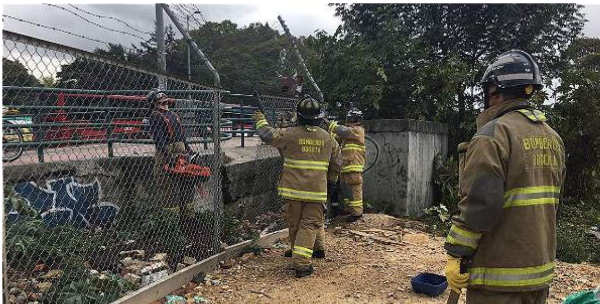
Operativo Humedal de Córdoba Agosto de 2016