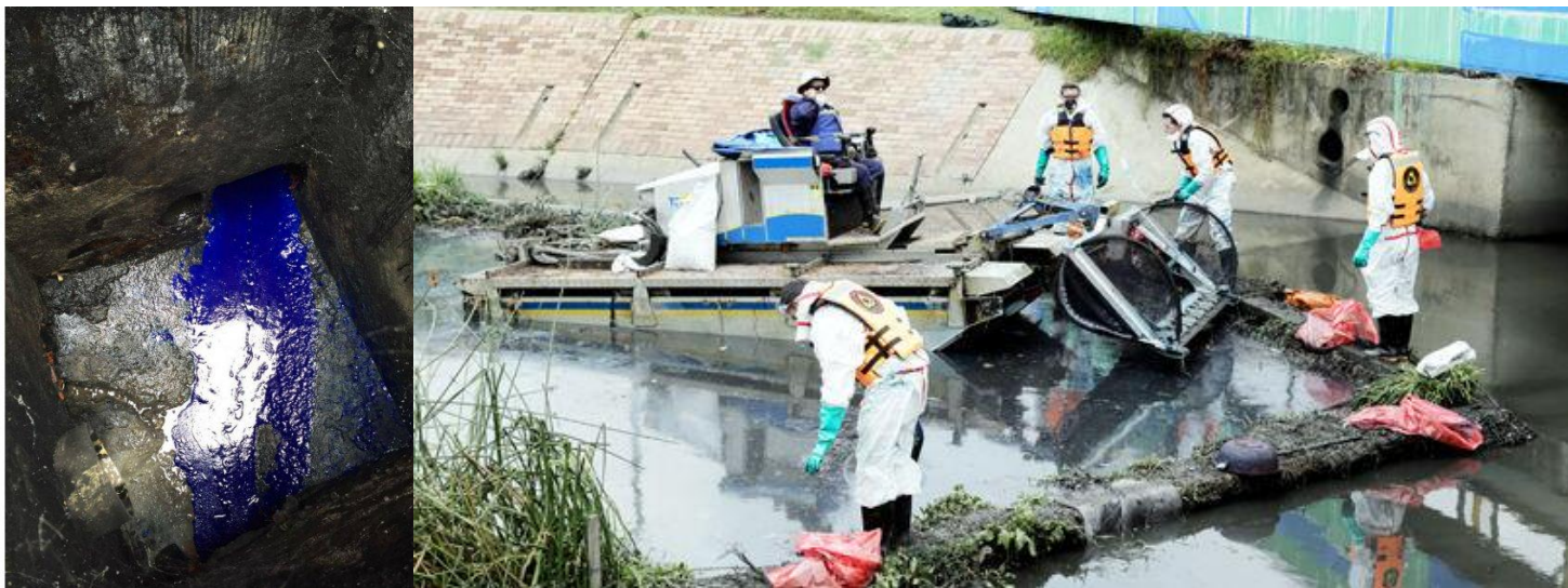
Operativo Humedal Jaboque Abril de 2016