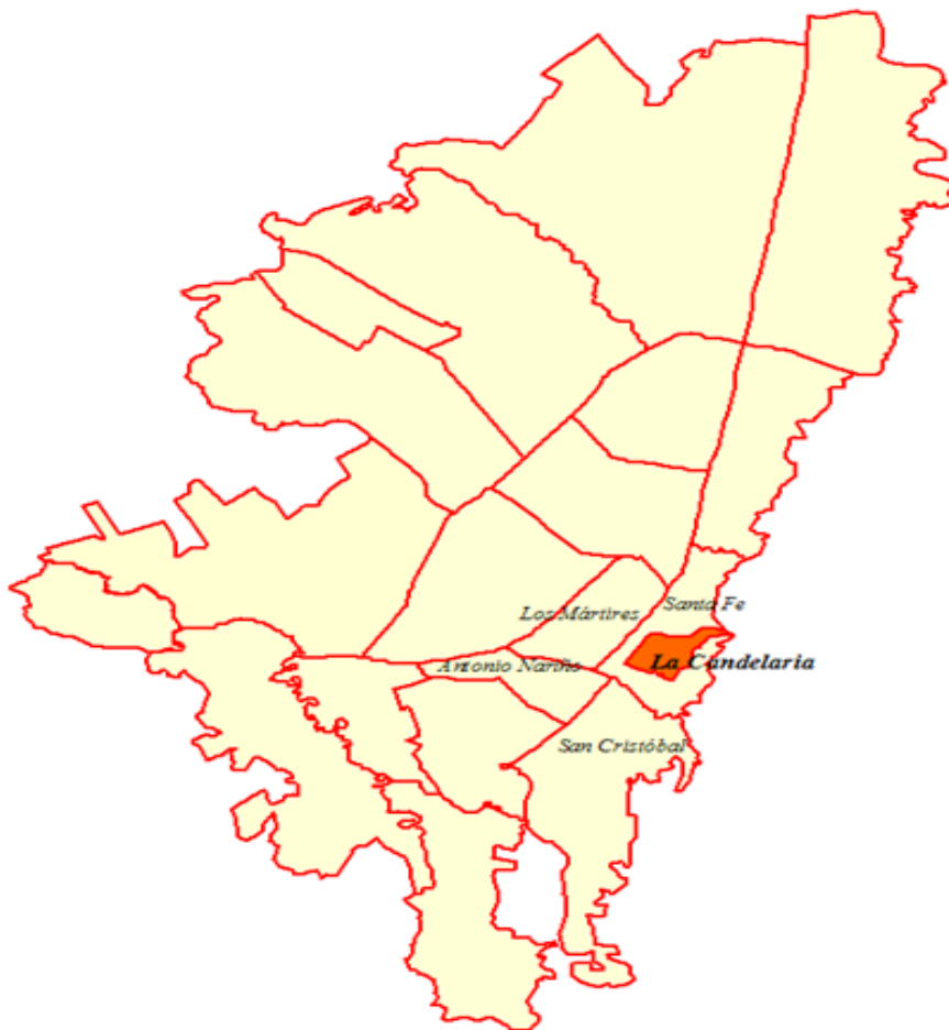
Figura 1. Localización en el área urbana de Bogotá