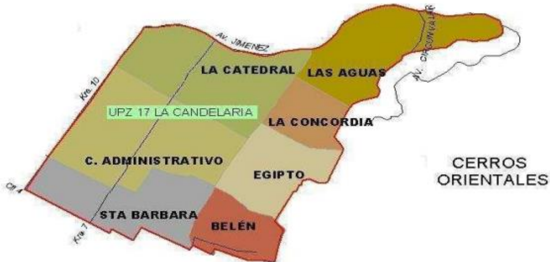
Figura 2. Localidad la candelaria con sus respectivos barrios