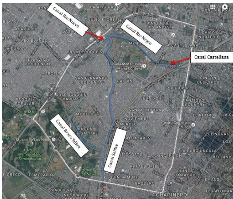
MAPA 2: CANALES LOCALIDAD BARRIOS UNIDOS

El canal de Río Negro se inicia en la carrera séptima con calle 88. Luego de recibir los colectores de agua lluvias de los cerros orientales, que conducen aguas del canal limitante del Chico, sigue por la calle 88 hacia el occidente y recibe a la altura de la carrera 30, los aportes del canal de La Castellana para verterlas a El Salitre, aguas arriba de la carrera 68, frente a Entreríos; al igual que el canal del río Nuevo, se ve afectado por el deficiente drenaje 11